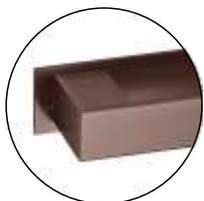
TCH TITANIUM CHOCOLATE (IN.16.152. __.TCH)