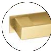
TG TITANIUM GOLD (IN.16.152. __.TG)

T. (+351) 224 663 230 / F. (+351) 224 839 841 / e-mail - jnf@jnf.pt / www.jnf.pt