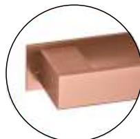
TCO TITANIUM COPPER (IN.16.152. __.TCO)