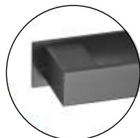
TB TITANIUM BLACK (IN.16.152. __.TB)